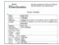
▶ 학교 Report