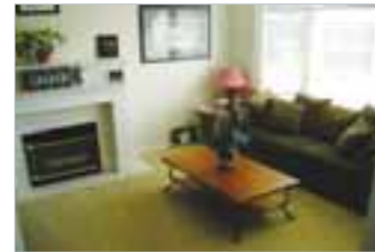
▶ Homestay 내부전경