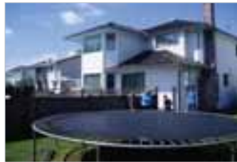
▶ Homestay 외부전경