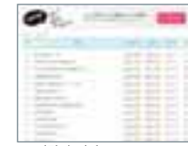
▶ 사람의 편지