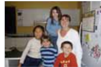
▶ Homestay 가족과 함께