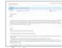
▶ Toell Class